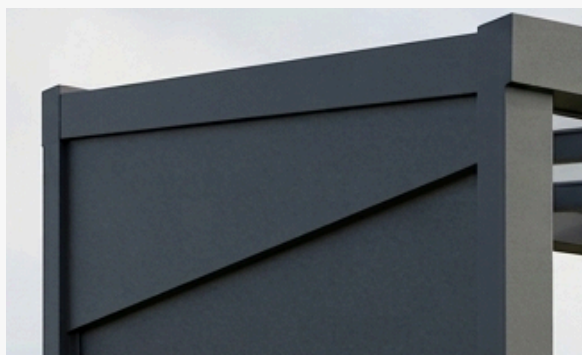
Klin boczny- Aluminiowy