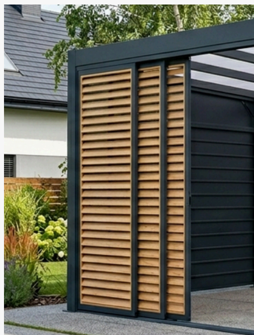
Ruchome Lamelle przesuwne