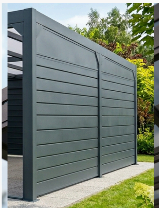
Panel Aluminiowe (Ściana Stała)